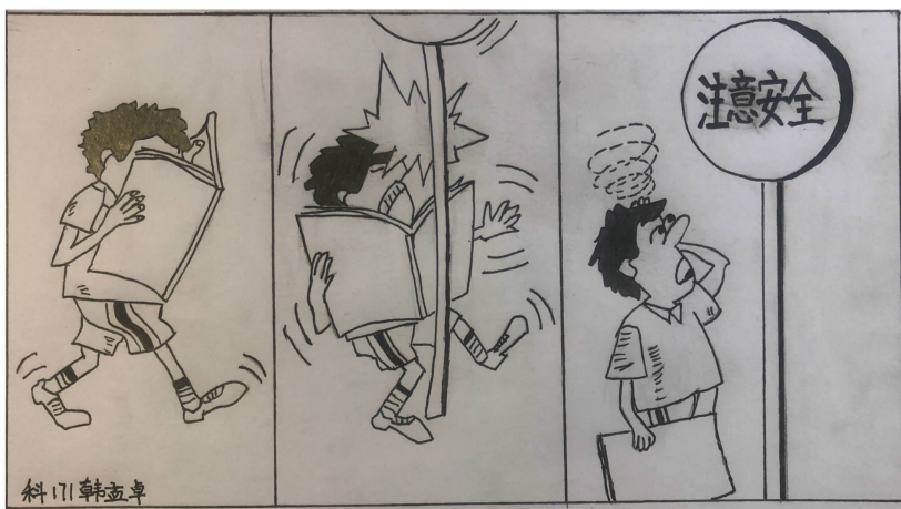
(国家安全教育日活动学生作品)

广大北石化学子还利用学习业余时间,纷纷加入当地抗疫志愿工作,以实际行动在抗疫一线维护公共安全,捍卫国家安全。(文/新闻中心资料来源:各院系)