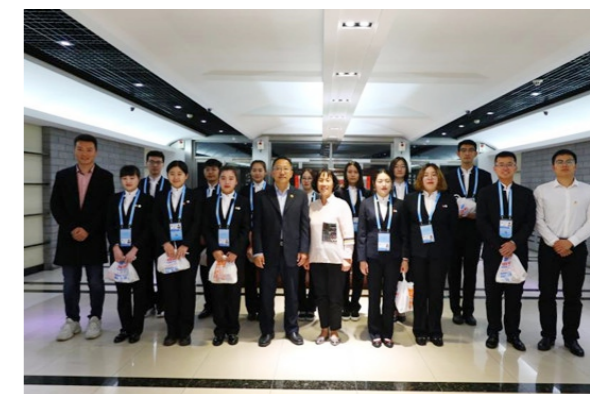
学校领导慰问志愿者

志愿服务是北京石油化工学院的优良传统。学校有参与2008年奥运会、田径运动会、中网公开赛、马拉松比赛、园博会等世界级赛事及大型活动的志愿服务基础。学校成立有大学生志愿者协会，目前，“志愿北京”团体注册21个，发布和组织志愿服务项39个，招募志愿者3万5千余次，共为社会提供了3万余人次、记录志愿服务时长6万余小时。近几年来，北石化学子还参加了第九届中国国际园林博览会、2016世界月季洲际大会、“砥砺奋进的五年”大型成就展、2017大兴区公祭日、大兴区徒步健走、2019年“新国门·新青年”志愿服务等大型活动，获得了社会各界的一致肯定。