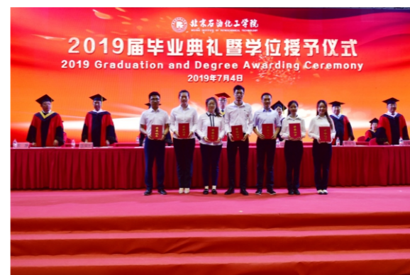
优秀硕士研究生毕业生 及优秀硕士学位论文获得者代表领奖

焦向东副校长宣读《2019届北京市普通高等学校优秀本科毕业生名单》及《2019届专业学位硕士研究生优秀学位论文获得者名单》。