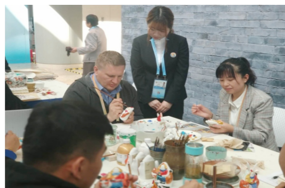
非遗区正在服务的志愿者

使命感和荣誉感圆满地完成了多项任务，充分展现了北石化学子的素质和青春活力，并获团市委、国内外媒体和与会嘉宾的广泛赞誉。