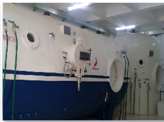
200 米级具有饱和潜水功能的高压焊接实验舱