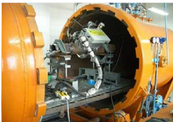
60 米级高压干式焊接实验舱

2006 年，完成了国家“863”计划项目<水下干式管道维修系统>子课题的海试验收，成为国内首家掌握 60 以内水下高压干式维修技术的单位。