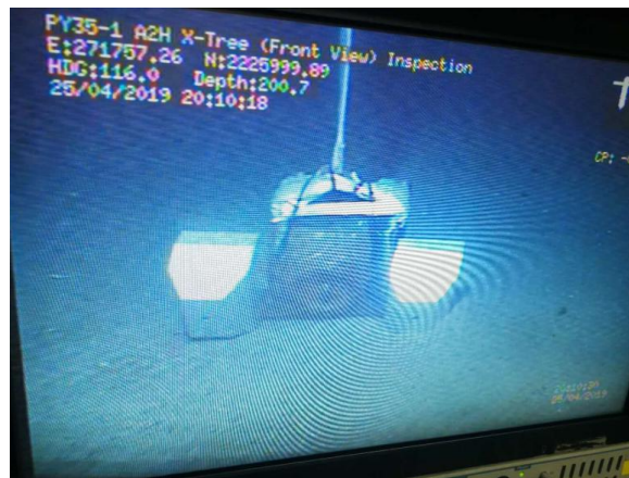
300 米级海试及焊接试件