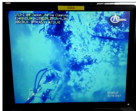
作业装备及其水下施工应用