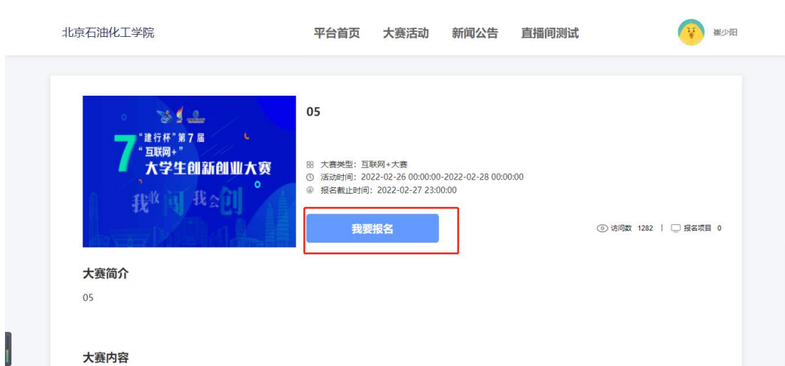
大赛活动详情页面