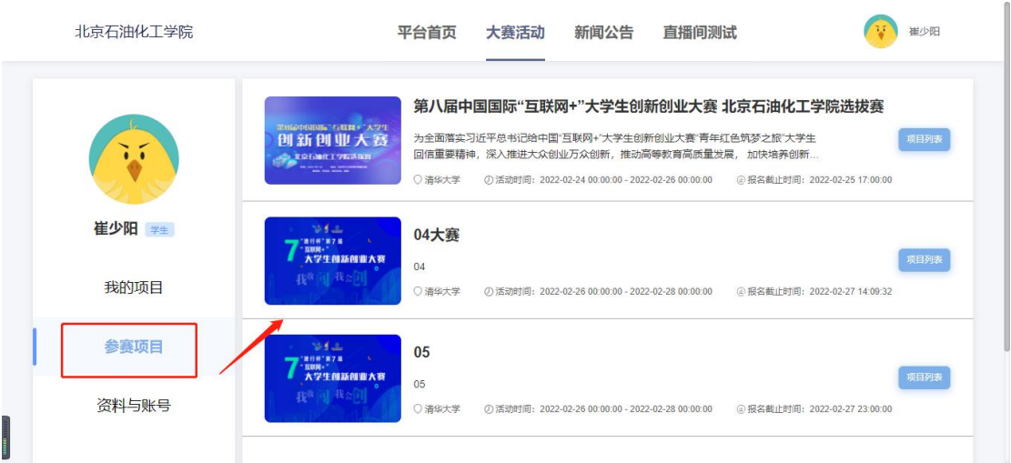
参赛项目-大赛列表页面