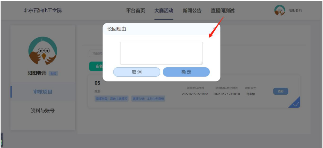
审核不通过-驳回理由