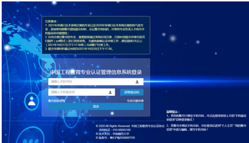
图 2“手机验证码登录”登录界面