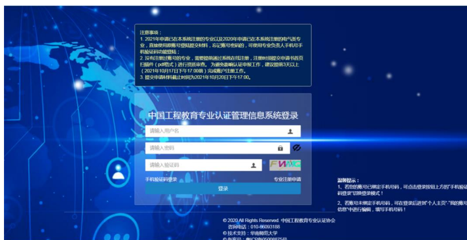
图 1 系统登录界面