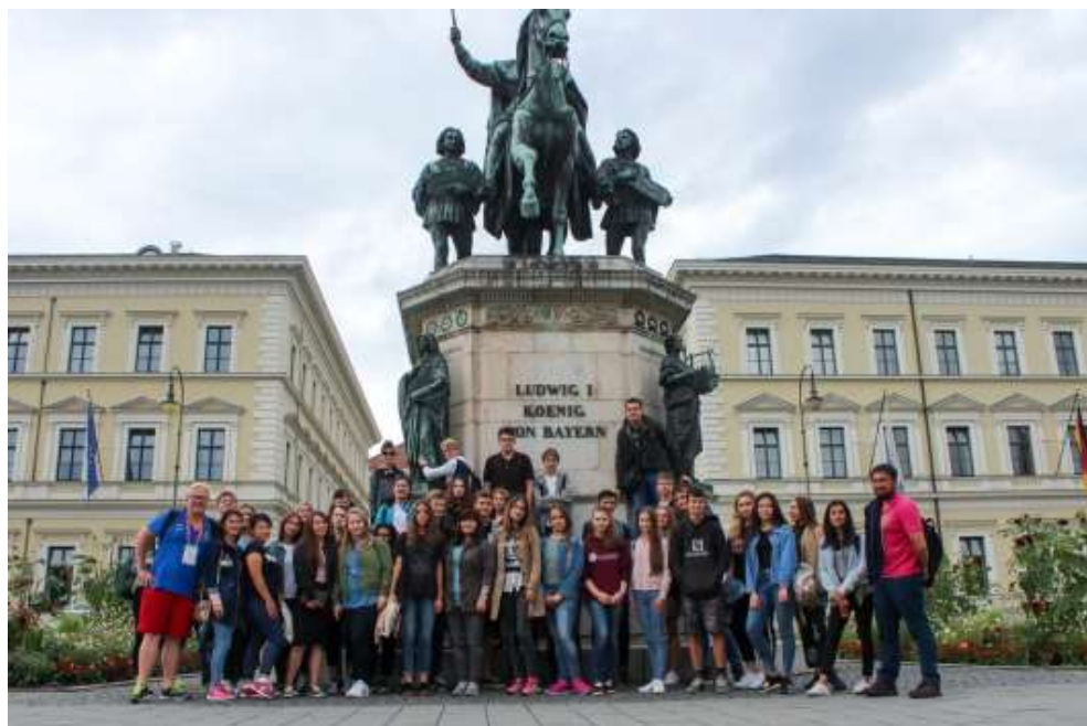
德国柏林/德累斯顿/慕尼黑参访