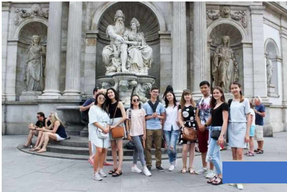
与其他国际学生在维也纳参访