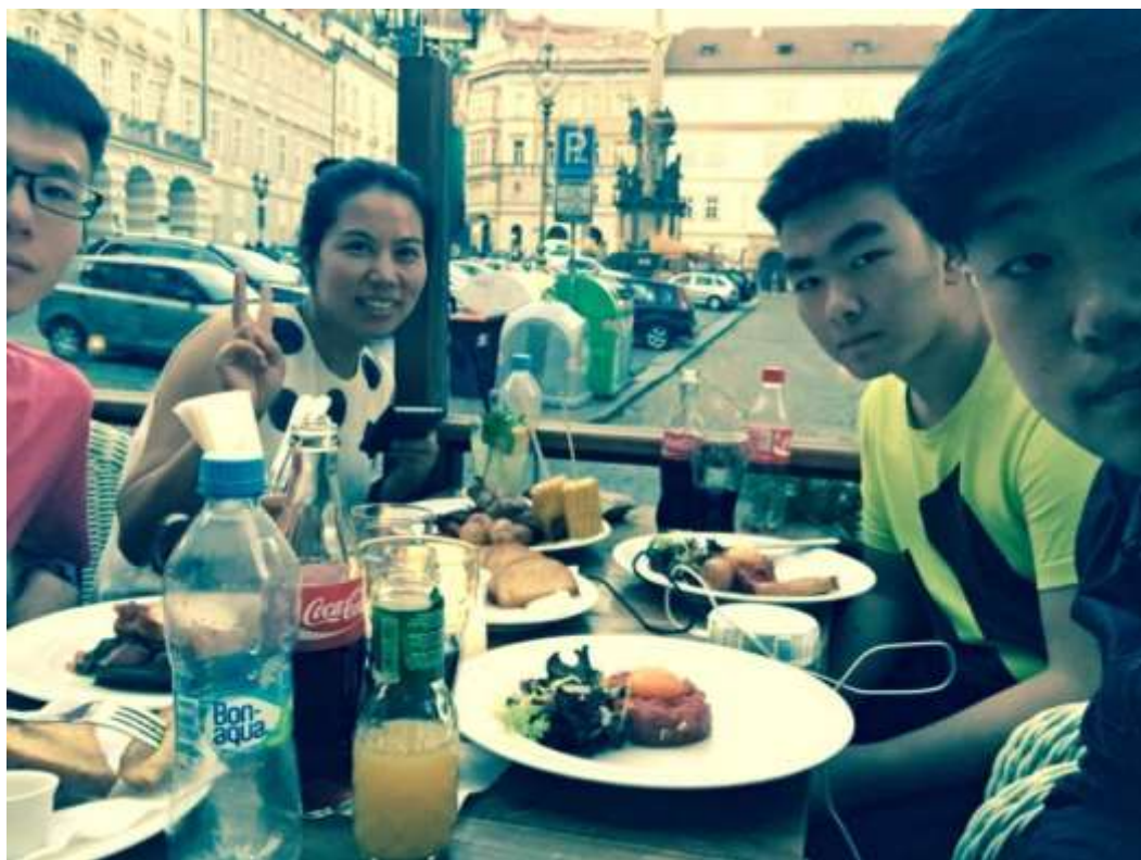
在布拉格老城广场附近就餐 (鞑靼生牛肉)