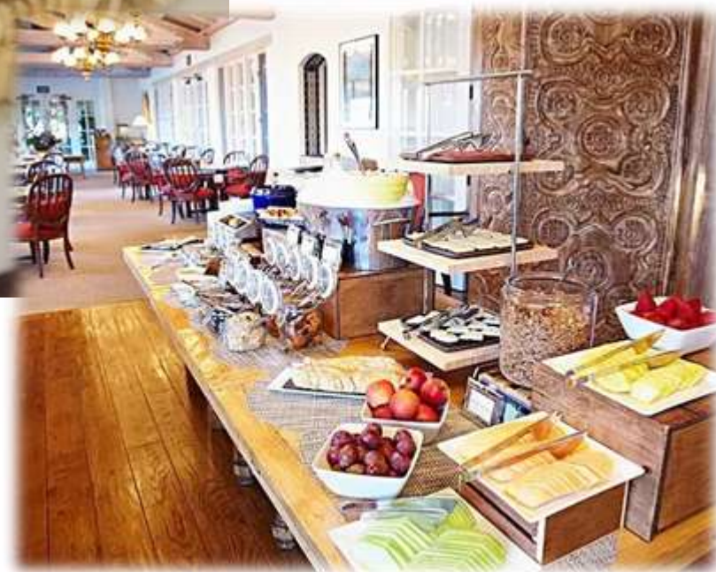
欧式早餐自助/晚餐捷克餐 (水果、蛋、各种肠、奶酪、黄油、牛奶、燕麦片、面包)