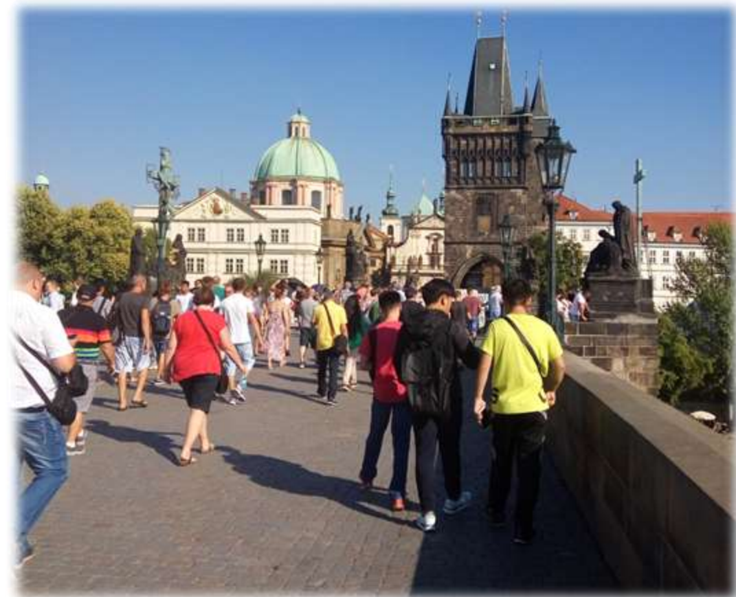
项目学员游览查理大桥

查理大桥（400多年历史）-布拉格的象征。 桥上有30尊雕像，被称为“欧洲的露天巴洛克塑像美术馆”！